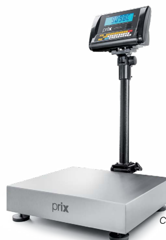
2098 C Coluna de 0,5 m