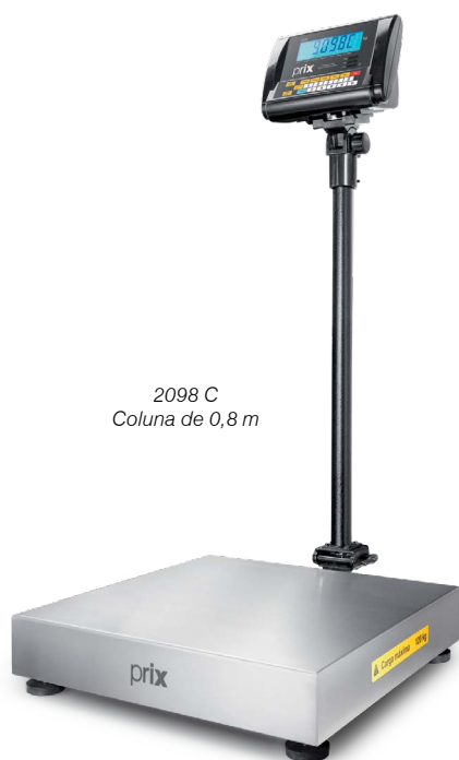
2098 C Coluna de 0,8 m

Possui barramento gráfico auxiliar no display, com setas acima e abaixo, para facilitar o monitoramento das faixas de tolerância dos produtos que estão sendo verificados. Permite configurar as tolerâncias máximas, inferior e superior do peso, determinando a faixa aceitável das pesagens.