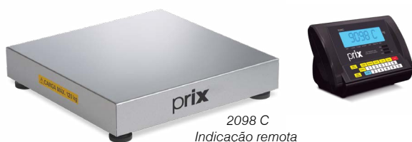
2098 C Indicação remota

Dispõe de dez níveis de filtro, permitindo adequar a balança às condições do local de instalação que possam interferir no tempo de estabilização da indicação do peso (vibrações ou correntes de ar).